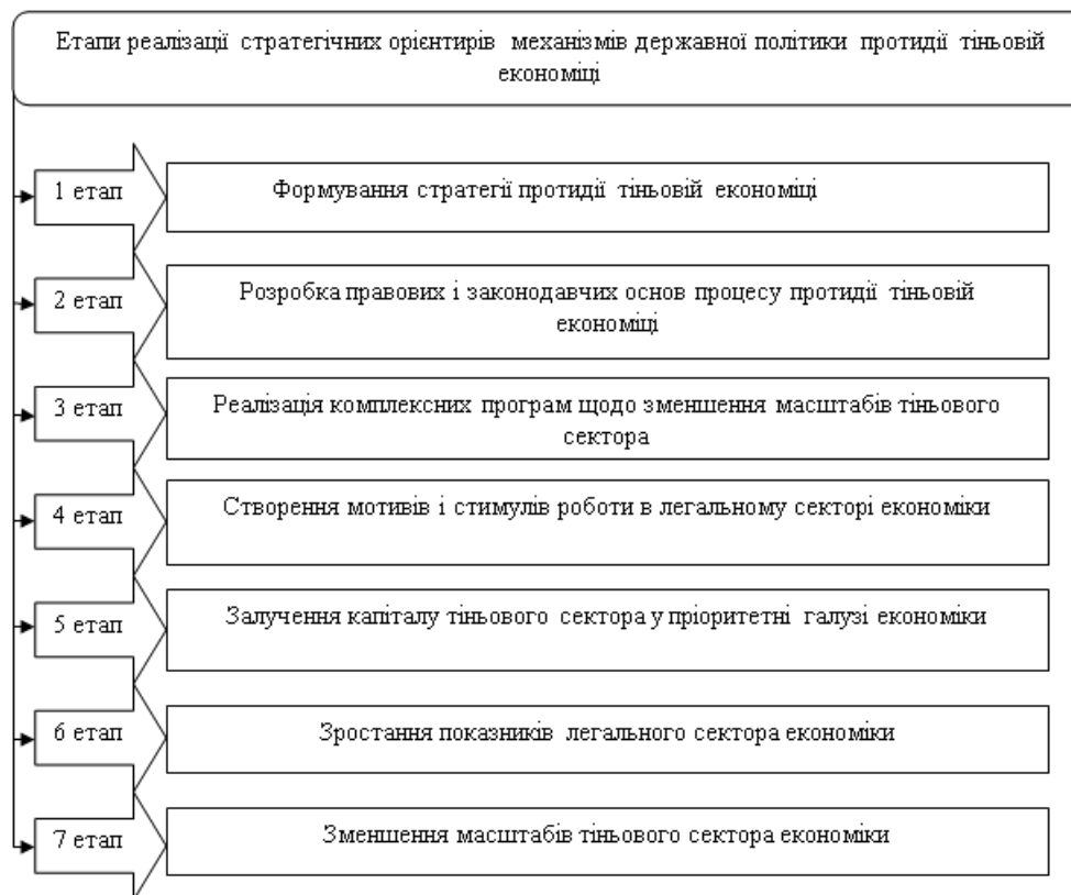
Рис.2. Етапи реалізації стратегічних орієнтирів механізмів державної політики детінізації національної економіки